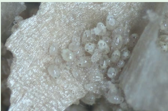
Fig. 1. C. lactis sobre el material de transporte.

En esta hoja informativa proporcionamos detalles sobre el uso del ácaro presa Carpoglyphus lactis como suplemento alimenticio para ácaros depredadores generalistas.