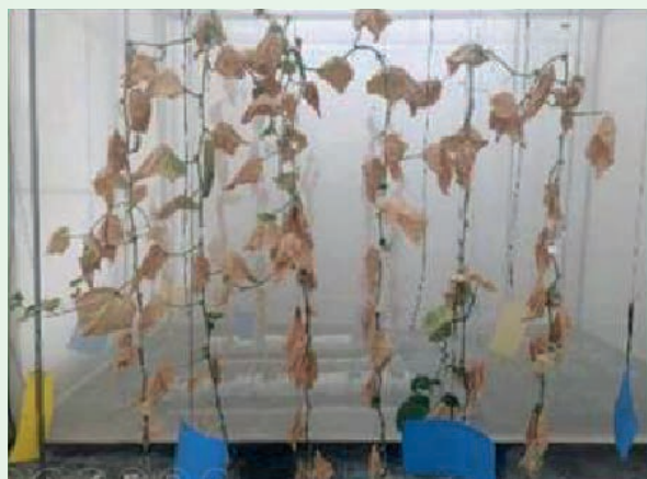
Fig. 5. Plantas de pepino al final del ensayo.

Izquierda: enfoque preventivo con alimentación complementaria. Derecha: control sin tratamiento.